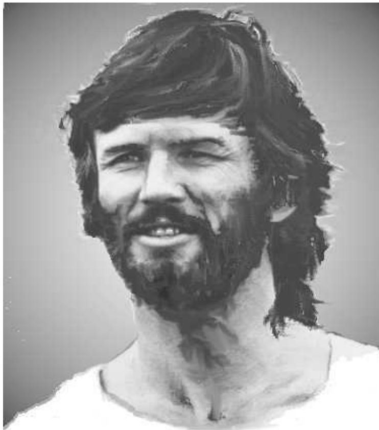
Judas de Kérioth

Maintenant, alors que je suis sur le point de te quitter, je tiens à te dire que j'aime bien la façon dont tu as dessiné mon portrait. J'étais un peu plus mince, mais c'est une bonne image. Merci. Tu as également reçu une vision d'André. Peut-être pourras-tu, un jour, peindre une galerie de portraits de tous les apôtres 13 ? Ce serait certainement très attrayant.