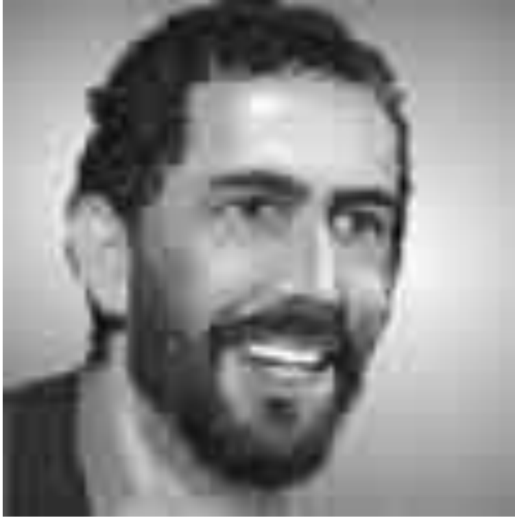
Joseph, le père de Jésus

Bien sûr, d'un point de vue spirituel, rien de tout cela est important. Par contre, comme un exemple des problèmes de médiumnité, c'est très important et cela a contrarié de nombreuses personnes. Cependant il serait absurde d'en déduire qu'aucune canalisation est sans erreur. C'est simplement que beaucoup trop de gens l'ont ainsi interprétée, en considérant la Bible comme leur source parfaite et sont devenus excessivement contrariés par le constat qu'une source spirituelle privilégiée n'était peut-être pas aussi parfaite qu'ils le pensaient. Nous reviendrons ultérieurement sur ce sujet, d'autant plus que Judas lui-même fut questionné à ce sujet et a donné une réponse détaillée.