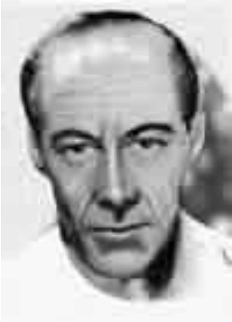
Publius Pontius Pilatus