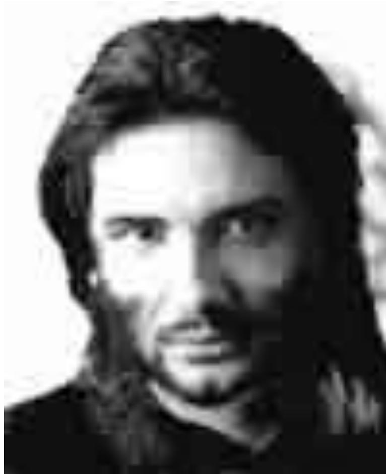
Simon le Zélote